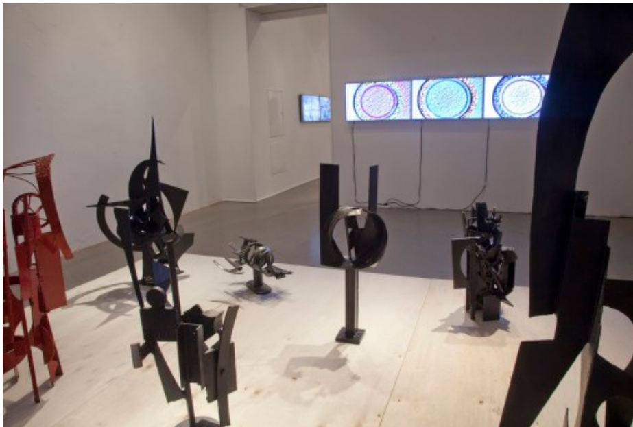
Jørleif Uthaug / Tor Jørgen van Eijk, Versus en , installasjonsbilde fra Trafo Kunsthall, 2016.

Trafo Kunsthall, Asker 21. mai - 26. juni 2016